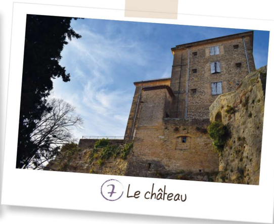
7 Le château