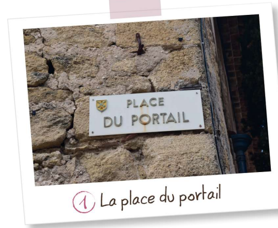
1 La place du portail