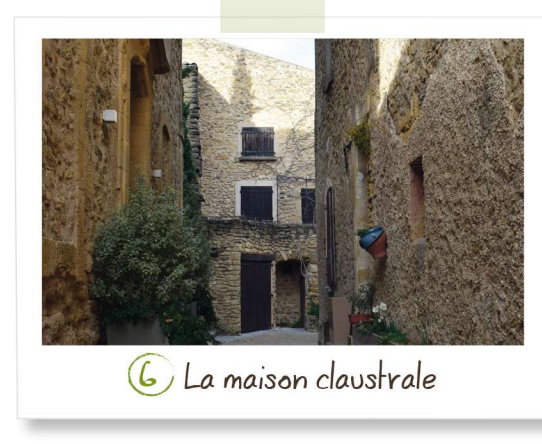
6 La maison claustrale

Ce site unique en Europe présente plus de 250 espèces de plantes dont on extrait des colorants pour la fabrication des encres, peintures et teintures. La culture des plantes tinctoriales, et notamment la garance, a longtemps été une industrie prospère à Lauris et en Provence. Consultez les horaires d'ouverture du jardin sur notre site internet : www.luberoncoeurdeprovence.com