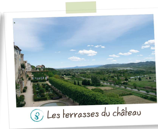
8 Les terrasses du château