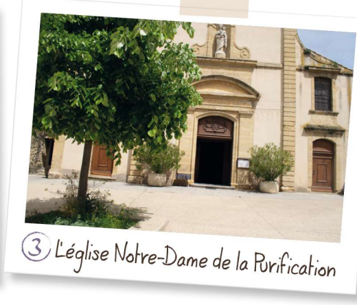
3 L'église Notre-Dame de la Purification