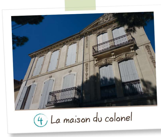
4 La maison du colonel