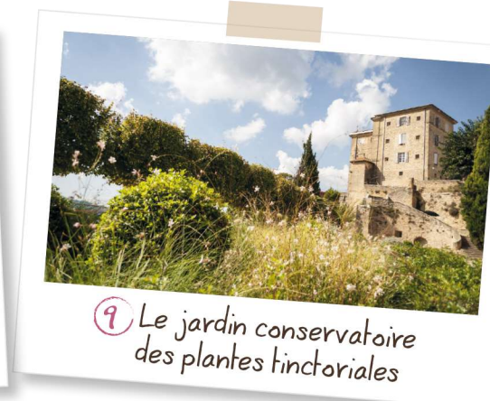
9 Le jardin conservatoire des plantes tinctoriales