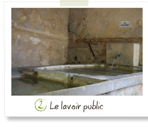
2 Le lavoir public